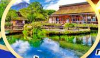
หมู่บ้านน้ำใสโอชิโนะฮัทโก