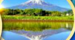
ทะเลสาบคาวากูจิโกะ