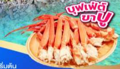
บุฟเฟ่ต์ ชาบู