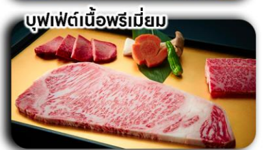
บุฟเฟ่ต์เนื้อพรีเมียม