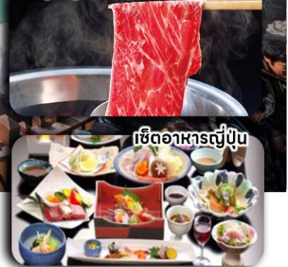
เซตอาหารญี่ปุ่น