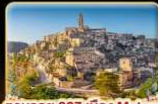
ตามรอย 007 เมือง Matera