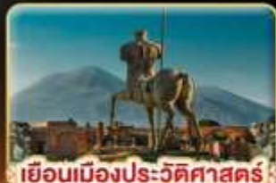
เยือนเมืองประวัติศาสตร์ ปอมเปอี