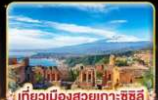
เที่ยวเมืองสวยเกาะซิซิลี Taormina