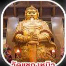
วัดเขangkงหมิว