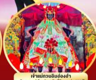
เจ้าแม่กวนอิมย้งฮงฮ่า นมัสการองค์เจ้าแม่กวนอิมที่มีอายุกว่า 600 ปี