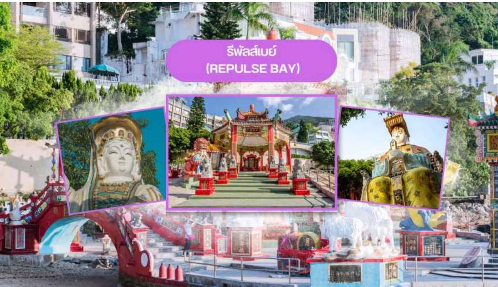
รีพัลส์เบย์ (REPULSE BAY)