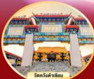
วัดหวังต้าเซียน ขอพรสุขภาพ ความรัก