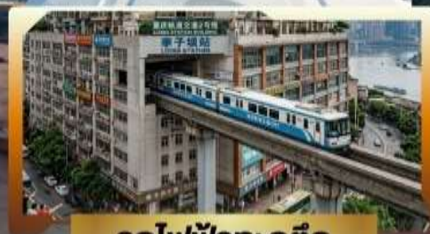
รถไฟฟ้ากะลุดัก