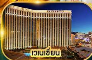
เวเนเซียน