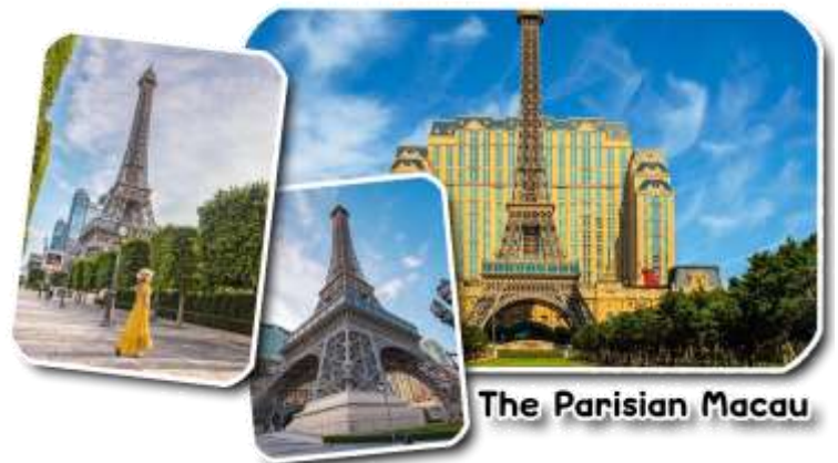
The Parisian Macau

และนำท่านชม The Parisian Macao (เดอะปารีสเซียน มาเก๊า) เป็นอีกหนึ่งแลนด์มาร์คของมาเก๊าที่ได้ยกหอไอเฟลมาจำลองใจกลางเมือง Cotai Strip โรงแรมแห่งนี้ได้รับแรงบันดาลใจมาจากเมืองปารีส ประเทศฝรั่งเศส นครแห่งศิลปะที่มีความงดงามทางด้านสถาปัตยกรรม ความโดดเด่นของหอไอเฟลกลิ่นอายของความคลาสสิกและความโรแมนติกมาไว้ที่โรงแรมแห่งนี้