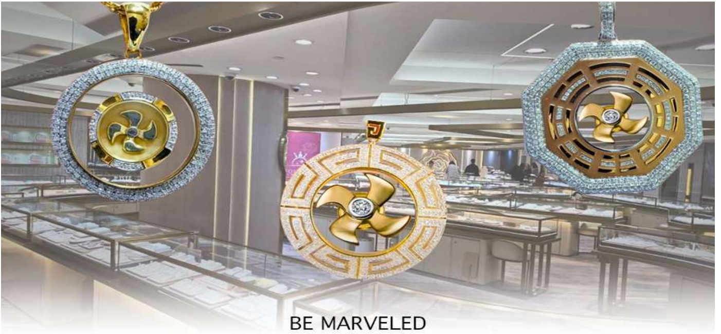
BE MARVELED គុណ័រវររុយ កវអ៊ុលគេសេឡី