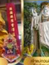
เจ้าแม่กวนอิม ไผ่โถง