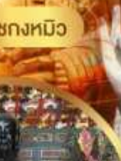
เจ้าแม่กวนอิม ริฟลิสเบย์