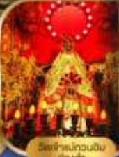
เจ้าแม่กวนอิม อึ้งซา