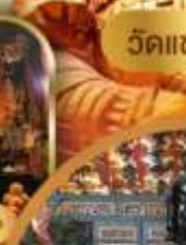
วัดปักโต