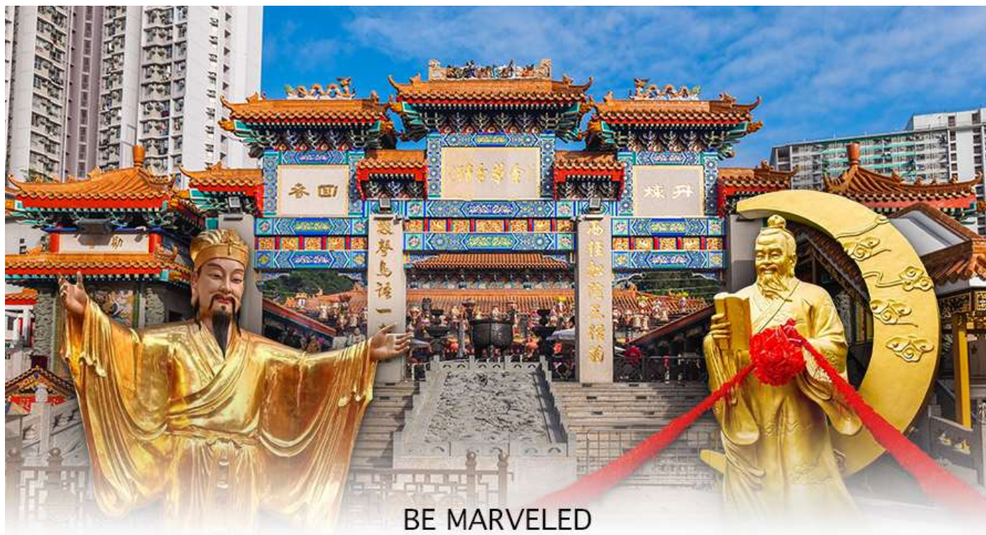
BE MARVELED วัดหวังต้าเซียน

พระหวังต้าเซียน หรือที่รู้จักกันในชื่อ ฮวงชูปิง (Huang Chu-ping) ในช่วงประมาณศตวรรษที่ 4 ได้เดินทางจากเมืองจินมาเผยแผ่ศาสนาในฮ่องกง และสร้างวัดแห่งนี้ขึ้นมาเมื่อประมาณปีค.ศ. 1921 ค่ะ ภายในวัดจะมีทั้ง เทพเจ้าหวังต้าเซียน, เจ้าแม่กวนอิม, เจ้าที่, เทพเจ้าหยุกโหลว (เทพเจ้าแห่งความรัก), ท่านขงจื้อ ซึ่งคนฮ่องกงเอง และนักท่องเที่ยวก็จะมากราบไหว้เพื่อสิริมงคลกัน โดยเฉพาะอย่างยิ่งคือ เทพเจ้าหยุกโหลว หรือ เทพเจ้าแห่งความรัก ที่เราเรียกกันว่า เทพเจ้าด้ายแดง เป็นพิภดที่หลายๆ คนมักจะไปขอความรักจากท่านกัน นอกจากนี้ที่เราจะต้องเอาด้ายแดงมาพันมือนี้อีก ตามป้ายที่แนะนำข้างหน้าแล้ว ไกด์นำเที่ยวคนฮ่องกงบอกว่าถ้าเป็นผู้หญิงอย่างเราอยากได้แฟน ก็ต้องไปผูกด้ายที่รูปปั้นผู้ชายและพอไหว้เสร็จแล้วก็อย่าลืมหยอดทำบุญใส่ตู้ไปด้วย