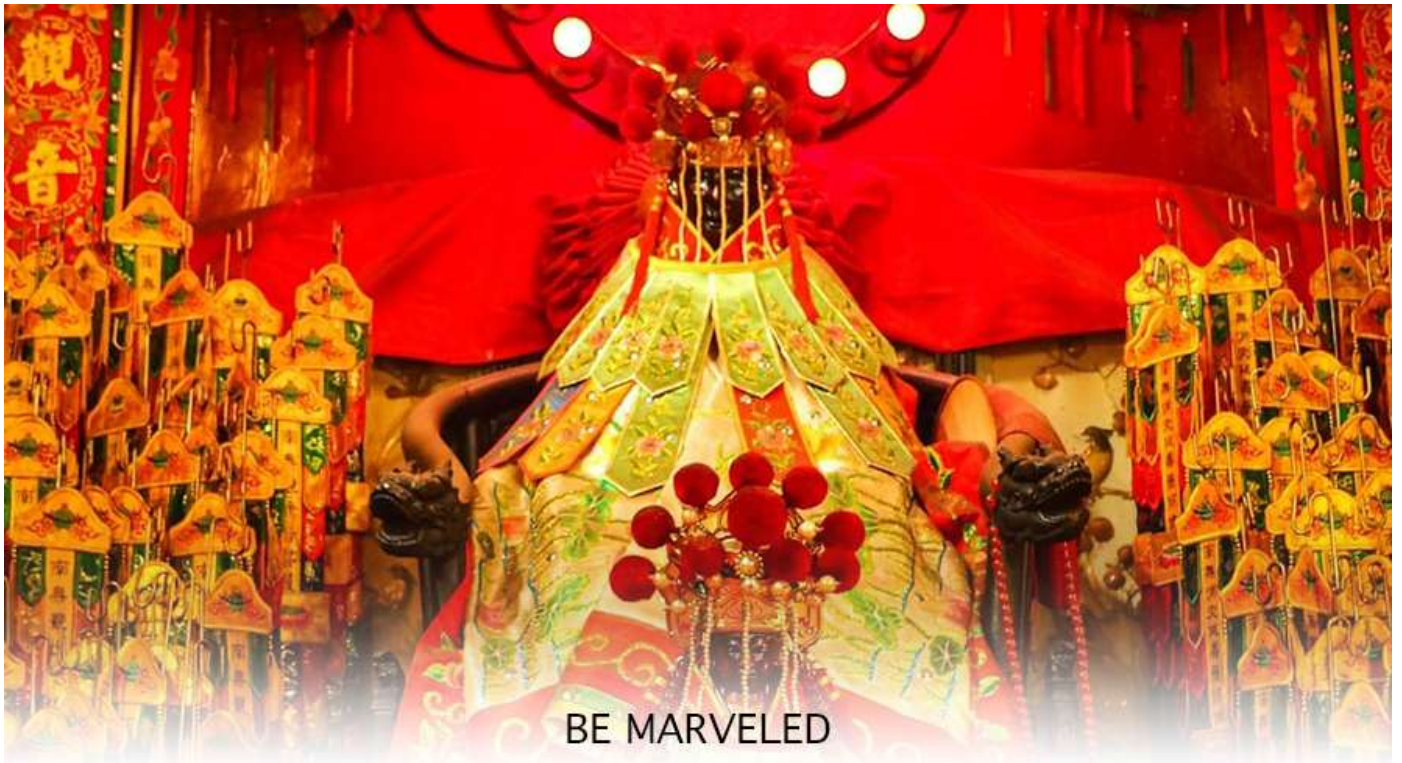
BE MARVELED วัดเจ้าแม่กวนอิมฮวงอ่า (ยิมเวิน)

ฮ่องกง-มาเก๊า จะมี "วันเปิดทรัพย์" หรือ "พิธียืมเงิน เจ้าแม่กวนอิมฮ่องกง" เป็นวันที่จะมาขอพรและยืมเงินเจ้าแม่กวนอิมซึ่งนับจากหลังวันตรุษจีน ไป 26 วัน จะเป็นวันเปิดทรัพย์ที่จัดขึ้นในทุกๆปี พิธีนี้จะมีเพียงครั้งปีละครั้งเท่านั้น เป็นวันสำคัญอีกวันที่คนหลังไหลมาไหว้ขอพรอย่างไม่ขาดสาย