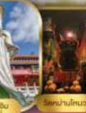
วัดนางไถ่