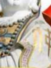
เจ้าแม่กวนอิม ริฟลิสเบย์