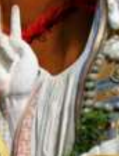
เจ้าแม่กวนอิม ริฟลิสเบย์