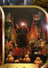
วัดนานโหมว