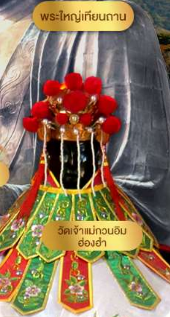
พระใหญ่เทียนถาน