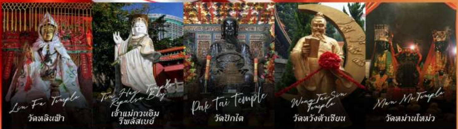
Lin Fe Temple วัดหลินฟ้า

รายการทัวร์ข้างต้นอาจมีการปรับเปลี่ยนเพื่อความเหมาะสม