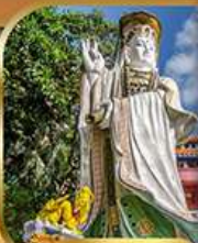
เจ้าแม่กวนอิม ริวฮัสนบย