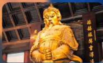
วัดเซ่งกงหมิว