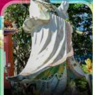
เจ้าแม่กวนอิมฮิมจิน