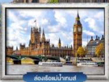
ล่องเรือแม่น้ำเทส