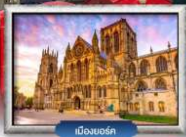
เมืองยอร์ก