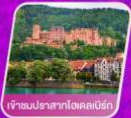
เจ้าชมนปราสาทไฮคอสเบิร์ก

🏨 โรงแรม 4 ดาว 🍴 อาหาร 14 มื้อ 🚿 โถงน้ำ เทียน 🚰 น้ำหนัก 23 กก.