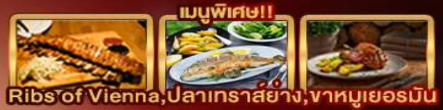
Ribs of Vienna, ปลาเทราสย่าง, ฆาตกรรมเยอรมัน

ตะลุยพิชิตยอดเขา Zugspitze "Top of Germany" เยือนเมืองมิวนิค จัดธุระสมาเรียนพลาซซ์ สัมผัสเมืองมรดกโลก เซสท์ ครุมลอฟ เยี่ยมชมปราสาทปราก ย้อนรอยอดีตซาลซ์บูร์ก สอนมิราเบล บ้านเกิดของโมสาร์ท ปราสาทบราติสลาวา มหาวิหารเซนต์มาร์ติน สุดโรแมนติกส่องเรือชมความงามแม่น้ำดานูบ จัดธุระสวีเดน พระราชวังฮอฟบวร์ก ขึ้นตากับความน่าหลงใหลของ หมู่บ้านริมทะเลสาบฮัลล์สตัดท์ พระราชวังเซินบรูน์ ปักท้ายช้อปปิ้งจุใจ