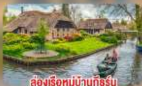
สองเรือหมู่บ้านทึร์รัน