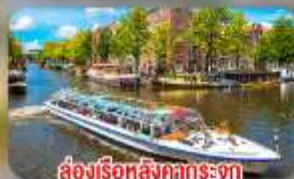
สองเรือหลังคากระจก