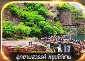
อุทยานสวรรค์ หยุนโก่ซาน