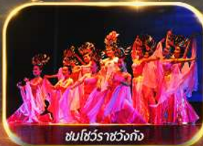
ชมโชว์ราชวงศ์ถัง

นั่งรถไฟความเร็วสูง ย้อนประวัติศาสตร์อันยิ่งใหญ่ "กองทัพทหารจิ้นซี" สัมผัสความงามอุทยานสวรรค์ พิเศษ!! ชมโชว์ราชวงศ์ถัง เก็บครบทุกไฮไลท์ ซ้อมบ๊องจู่ ห้าง WU YUE