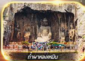
ถ้ำพาลงเหมิน