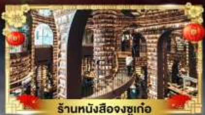
ร้านหมังซือจงซูเก๋อ

ดินแดนสวรรค์ความสูง 4,860 เมตร "ตำกู่ปิงชวน & กู๋เจาสีดรุณี"