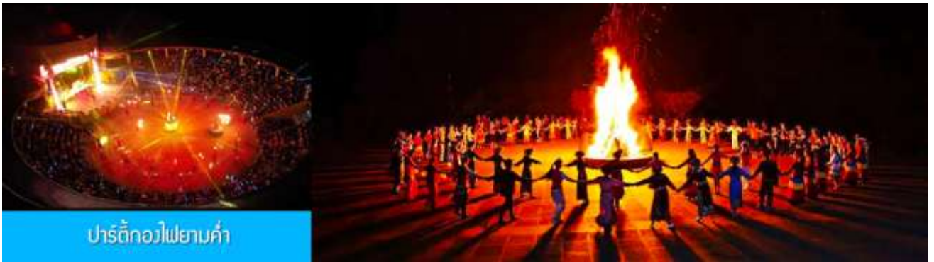
ปาร์ตี้กองไฟยามค่ำ