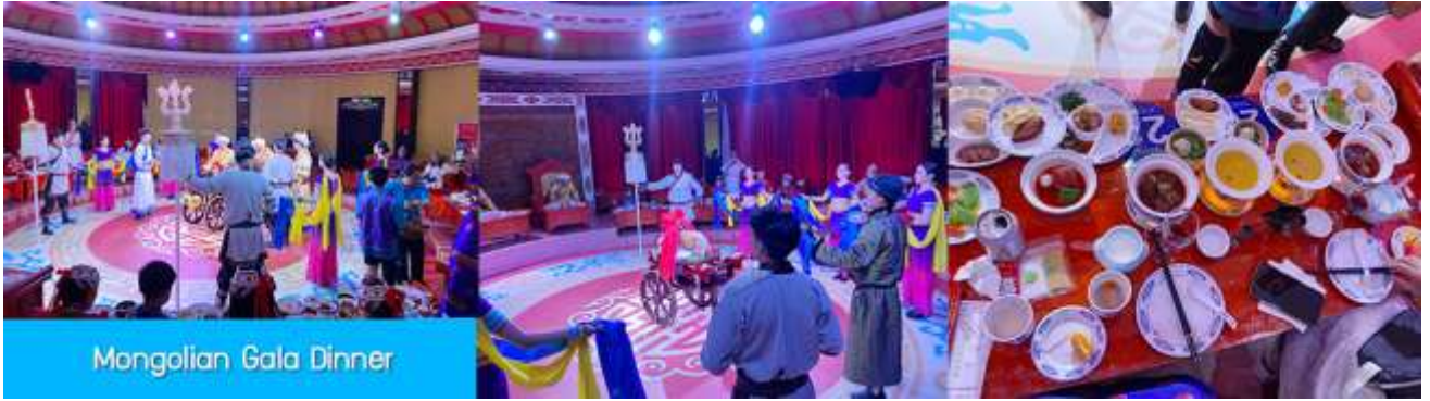
Mongolian Gala Dinner