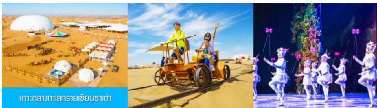
เกาะกลางทะเลทรายเขียนซาเต๋า