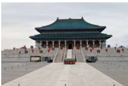
สวนวัฒนธรรม หมงกู่หยวนหลิว

หลังอาหารนำท่าน เที่ยวชม จวนอ๋องจวินหวัง 郡王府 จวนแห่งนี้เริ่มสร้างขึ้นในปี ค.ศ. 1902 สร้างเสร็จในปี ค.ศ. 1936 เป็นที่พำนักของ อ๋องอีฉีจวินหวัง 伊旗郡王 เป็นจวนอ๋องเพียงหนึ่งเดียวที่ได้รับการอนุรักษ์ในสภาพที่สมบูรณ์ โครงสร้างทำด้วยอิฐ หิน และไม้ ประกอบด้วยห้องพัก 16 ห้อง เป็นสถาปัตยกรรมผสมแบบมองโกลทิเบต และฮั่น