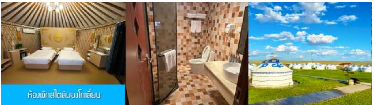
ห้องพักสไตล์มองโกลเลียน