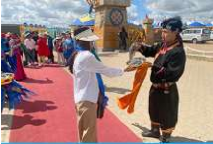
พิธีต้อนรับแขกด้วยเหล่า