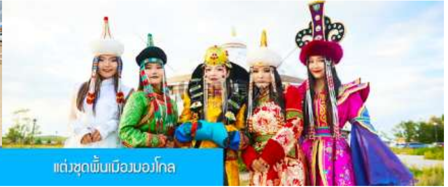
แต่งชุดพื้บเมืองมองโกล