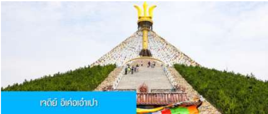
เจดีย์ อี้เค่ออ่าเป่า

พักที่ DALAETQI SHNAGJING HOTEL โรงแรมระดับ 4 ดาวหรือเทียบเท่าในเมืองต้าลาเท่อ