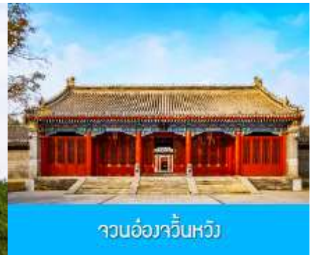
จวนอ๋องจวินหวัง

วันที่หก เมืองเออร์ดอส –อี้เค่ออ่าเป่า–จวนอ๋องจวินหวัง- สวนวัฒนธรรมหมงกู่หยวนหลิว-ซื้อปิ้งถนคนเดิน