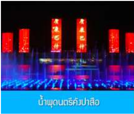
น้ำพุดนตรีคังปาสือ