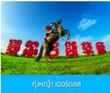
ทุ่งหญ้า เออร์ดอส

พักที่ ORDOS BOYU AIRUI HOTEL โรงแรมระดับ 4 ดาวท้องถิ่น หรือเทียบเท่าในเมืองเออร์ดอส