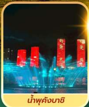
น้ำพุคังบาซี