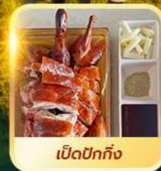
เปิดปีกทั้ง