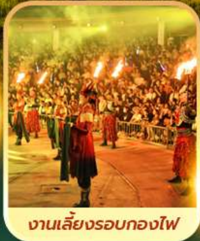
งานเลี้ยงรอบกองไฟ