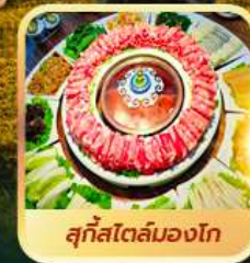
สุกีสโตลิมองโก