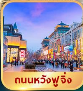
ถนนหวังฟู่จิ่ง