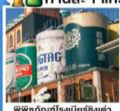
พิพิธภัณฑ์โรงเบียร์ชิงเต่า