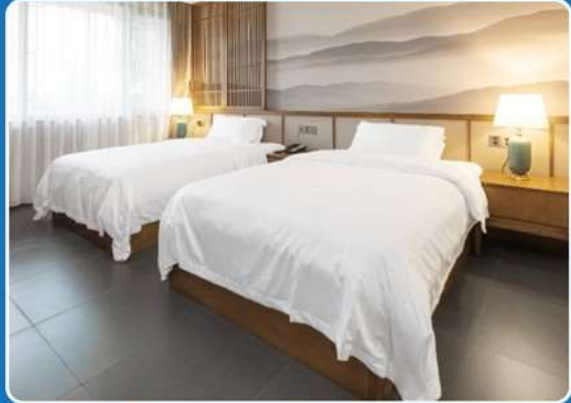
👤👤 TWIN (TWN)