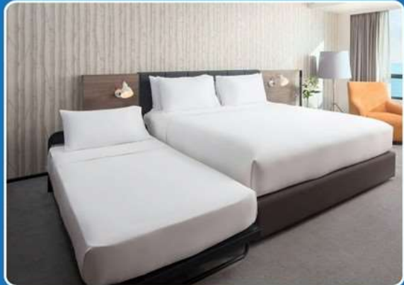
👤👤+👤 TRIPLE (TRP)

**รูปภาพห้องพักเป็นเพียงภาพสื่อถึงประเภทของเตียงเท่านั้น ไม่ใช่ภาพห้องพักจริงสำหรับการเข้าพัก**