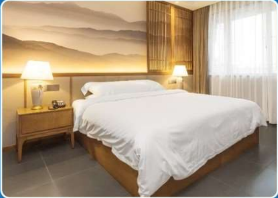
👤 SINGLE (SGL)