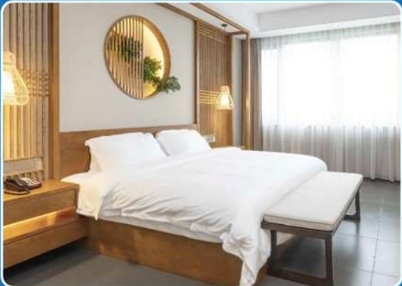
👤👤 DOUBLE (DBL)