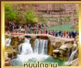
หยุ่นโกซาน