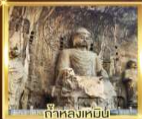
ถ้ำหลงเหมิน