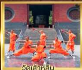
วัดเล่าหลิน