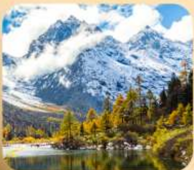
“ปี่ผิงโกว”

ชมธรรมชาติ 2 อุทยานขึ้นชื่อ อุทยานภูเขาสี่ดรุณี + อุทยานปี่ผิงโกว สะพานหนานเฉียว • ถนนคนเดินไถ่กู่หลี่ + ซุนซีลู่ + Pop Mart • ดงเจียวจื่อ