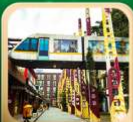
“ดงเจียวจื่อ”