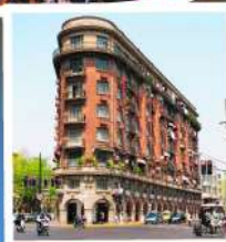
ถนนอู๋คิง