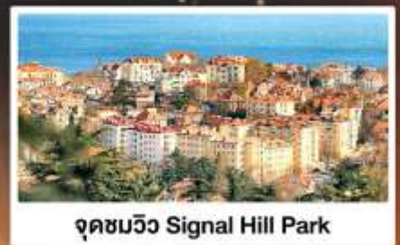
จุดชมวิว Signal Hill Park