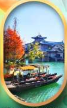
เมืองโบราณผู้หยวน