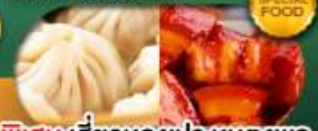
พิเศษ เสี่ยงหลงเป่า หมูตงพอ เดินทาง ม.ค. - มิ.ย. 69