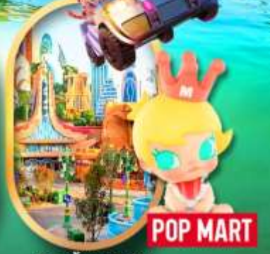
เลือกซื้อทัวร์เสริม เซี่ยงไฮ้ ดิสคัสนีย์แลนด์