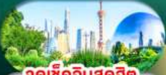
จุดเช็คอินสุดฮิต North Bund Shanghai

เซี่ยงไฮ้ หางโจว ล่องทะเลสาบซีหู ฟรีเดย์