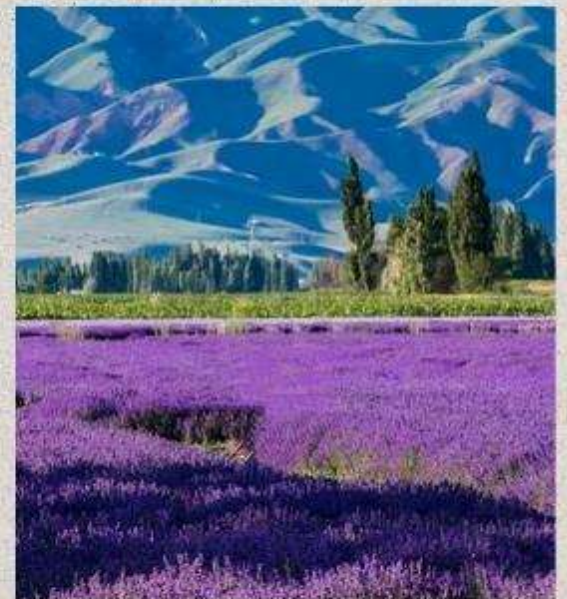
สวนดอกไม้้อีลีเทียนซาน