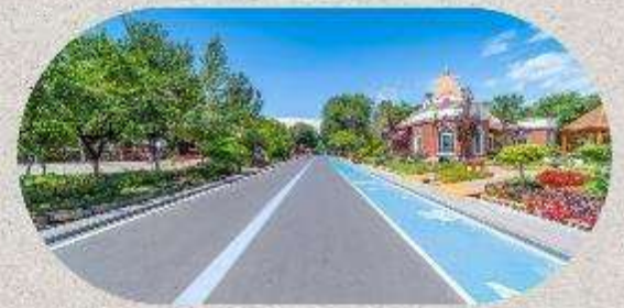
หมู่บ้านโบราณอุยกูร์คาจันจี