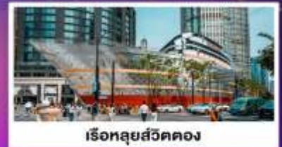
เรือทลุยสวีตคอง