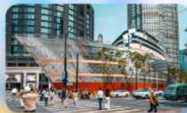
เรือหลุยส์วิตคอง