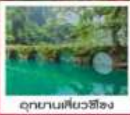
อุทยานเสี้ยวซือ