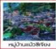
หมู่บ้านแก้วชียง