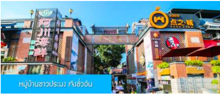
หมู่บ้านชาวประมง เจิงชว้ออัน