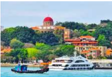
เกาะกู่ลิ่งหยี่

พักที่ โรงแรม XIAMEN HENGLONG HOTEL 4* หรือเทียบเท่าในเซี่ยเหมิน