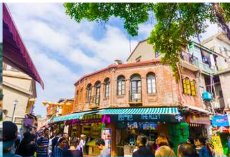
ถนนคนเดินหัวมังกร