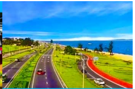
ถนนหวนเต่าลู่