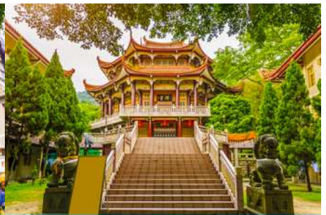
วัดหนานกั๋วซื่อ