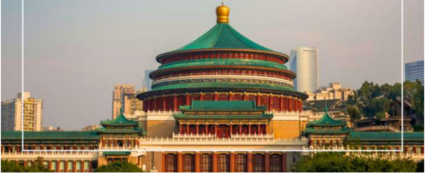
มหาศาลาประชาชนแห่งเมืองฉงชิ่ง (Chongqing People's Grand Hall)

เที่ยง บริการอาหารเที่ยง ณ ภัตตาคาร (มื้อที่ 7) เมนูพิเศษ : สุกี้หม่าล่า