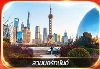
สวนนอร์มันด์