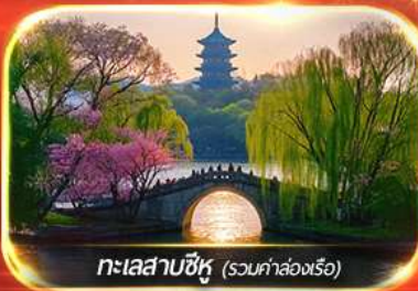
ทะเลสาบซีหู (รวมค่าล่องเรือ)