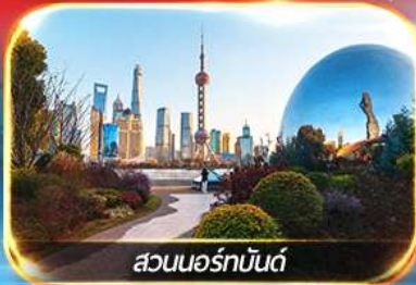
สวนออร์ทันด์