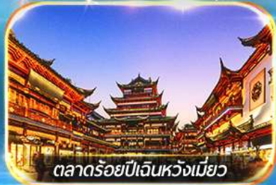
ตลาดร้อยปีเงินหวงเมียว

ถ่ายรูปชมสวนออร์ทันด์ , เขคอินหาโต่วถาน, วัดพระหยกขาว อิสระช้อปปิ้งถนนนานกิง POPMART FLAGSHIP STORE