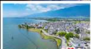
ทะเลสาบเอ๋อไห่