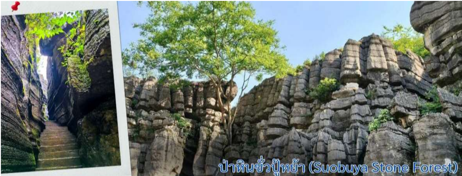
ป่าหินซั่วปู้หย้า (Suobuya Stone Forest)

จากนั้นนำทุกท่านเดินทางสู่ ป่าหินซั่วปู้หย้า (Suobuya Stone Forest) คือ เป็นสถานที่ท่องเที่ยวระดับชาติเกรด AAAA ของจีน ตั้งอยู่ห่างจากเมืองเอนซี มณฑลหูเป่ย์ ไปทางเหนือ 54 กิโลเมตร ในภาคกลางของจีน ได้รับการขนานนามว่าเป็นป่าหินที่ใหญ่เป็นอันดับสองของจีน (อันดับแรกคือป่าหินในเมืองคุนหมิง มณฑลยูนนาน ทางตะวันตกเฉียงใต้ของจีน) และเป็นสถานที่ที่นักท่องเที่ยวที่ชื่นชอบ สามหุบเขาของแม่น้ำแยงซีต้องไปเยือน ครอบคลุมพื้นที่ทั้งหมด 21 ตารางกิโลเมตร ระดับความสูงเฉลี่ยมากกว่า 900 เมตร หากมองจากมุมสูง พื้นที่ท่องเที่ยวแห่งนี้มีรูปร่างคล้ายน้ำเต้าขนาดใหญ่ ล้อมรอบด้วยฉากสีเขียวและยอดเขา ป่าหินซั่วปู้หย้าเป็นป่าหินที่ใหญ่เป็นอันดับสองของจีน โดยมีพิพิธภัณฑสถานเป็นอันดับหนึ่งของประเทศ และนี่คือสิ่งที่ทำให้โดดเด่นกว่าหินปูนอื่นๆ ในภาคตะวันตกเฉียงใต้ของจีน ป่าหินซั่วปู้หย้ามีพิพิธภัณฑสถานขึ้นปกคลุมอย่างหนาแน่นราวกับสวมหมวก จึงได้ชื่อว่า ป่าหินสวมหมวก