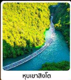
หุบเขาสิงโต

โอโห่! ปีนตรงลงเอินซือ ที่ยวเอินซือเน้นๆจัดเต็มทั่วเมือง หุบเขาสิงโต ผิงซานแกรนด์แคนยอน อุทยานจีนลี่ซ่าน