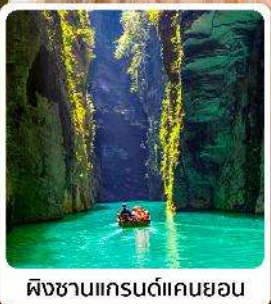
ผิงซานแกรนด์แคนยอน