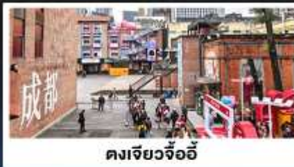
ตงเจียวจ้ออี้