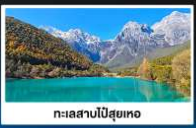
ทะเลสาบโป๋ส่วยเหอ