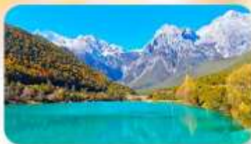
ทะเลสาบไป๋สุยเหอ