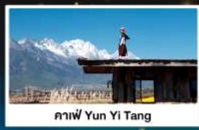
กาแฟ Yun Yi Tang