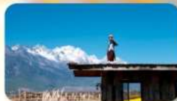
กาแฟ Yun Yi Tang