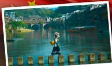
หมู่บ้านเฟิ่งทง

สุดคุ้ม!! พัก 5 ดาว ทุกคืน มนตร์เสน่ห์เมืองเก่า ริมสาងน้ำแจ่มใสแดน