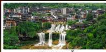
หมู่บ้านฟุทงเจิน