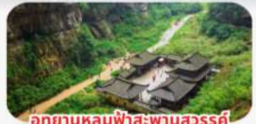
อุทยานหลุมฟ้าสะพานสวรรค์