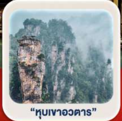
"หุบเขาอวตาร"

นั่งกระเช้าชมภูเขาเทียนเหมินซาน • กำประตูลิ่ว • ตึกมหัศจรรย์ 72 ชั้น เมืองโบราณเฟิ่งหวง (สองเรือ) + เมืองโบราณฟูหรงเจิน **พักติดเมืองโบราณ 2 คืน** ภูเขาเทียนจื่อซาน • หุบเขาอวตาร • สะพานแก้ว+VR4D • ชมโชว์จิ้งจอกขาว