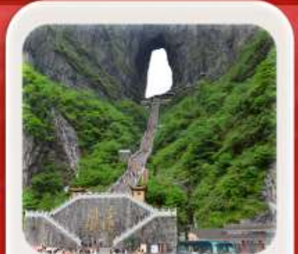
"กำประตูลิ่ว"