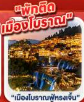
"เมืองโบราณฟูหรงเจิน"