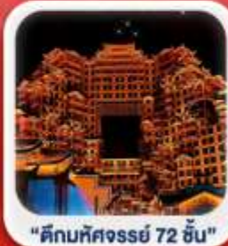
"ตึกมหัศจรรย์ 72 ชั้น"