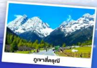
ภูเขาสีครุณี