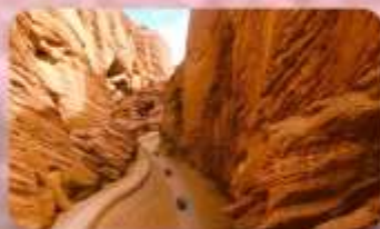
แกรนด์แคนยอนอาจูซือ