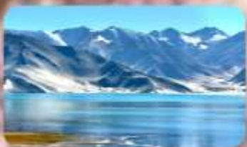
ทะเลสาบไป๋ซาหู