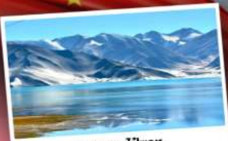
ทะเลสาบโปซาทุ

เปิดประตูสู่อารยธรรมพันปีแห่งซินเจียงใต้ ชมความสวยงามของหมู่บ้านดอกแอปเปิ้ล