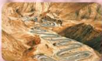
ถนนโบราณผืนหลงกุ่เต้า