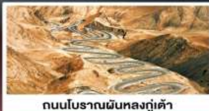
ถนนโบราณผืนหลงกู่เต้า