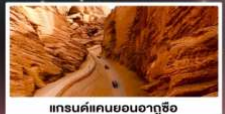
แกรนด์แคนยอนอาถูซื่อ