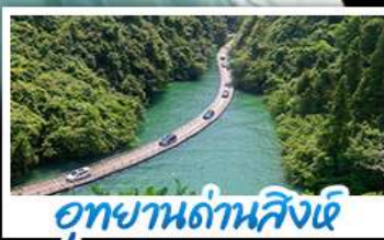
อุทยานด้านสิงห์