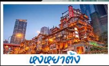
แสงสถาปัตยกรรม