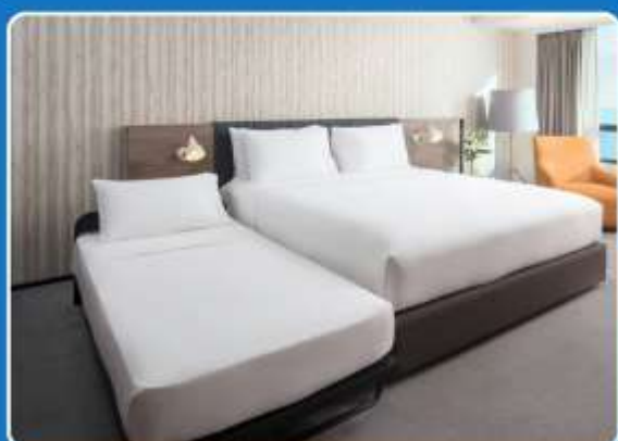
👤👤+👤 TRIPLE (TRP)

**รูปภาพห้องพักเป็นเพียงภาพสื่อถึงประเภทของเตียงเท่านั้น ไม่ใช่ภาพห้องพักจริงสำหรับการเข้าพัก**