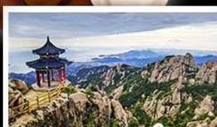
ภูเขาเหลาซาน