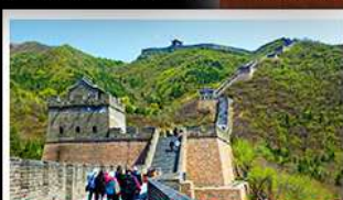
กำแพงเมืองจีนด้านจวิยงกวน