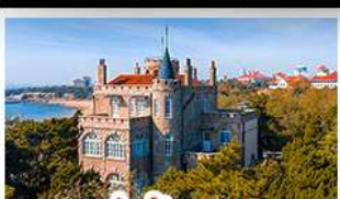
ป่าตักกวน

พระราชวังฤดูร้อน - วิวเมืองซิงเต่า รถไฟความเร็วสูง - ภูเขาเหลาซาน กำแพงเมืองจีนด้านจวิยงกวน - ป่าตักกวน พักโรงแรมระดับ 4 ดาว - ไม่ลงร้านซื้อ มือพิเศษ เปิดปักกิ่ง , หม้อไฟซีฟู้ด