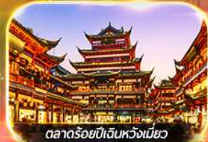
ตลาดร้อยปีเงินหวงเหมียว

เที่ยวดิสนีย์แลนด์เต็มวัน (รวมบัตร + รถรับส่ง) ช้อปปิ้งย่านดัง นานกิง, เงินหวงเหมียว