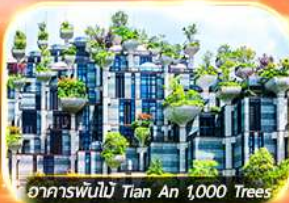
อาคารพันไม้ Tian An 1,000 Trees