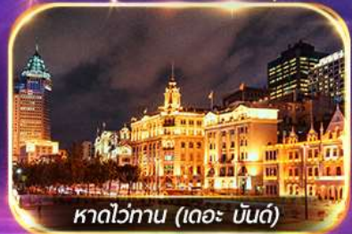
หาดไว่ทาน (เดอะ บันด์)

เที่ยวดิสนีย์แลนด์เต็มวัน (รวมรถรับ-ส่ง)