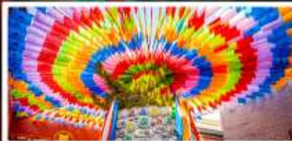
วัดลามะกว้างเหริน