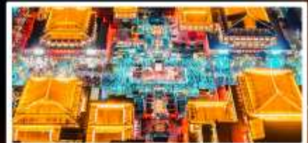
ถนนวัฒนธรรมต้าถิง