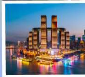
ตึกรูปเฟี๊